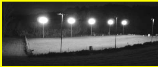
Vista nocturna instalaciones (40.000 W)