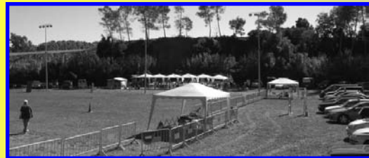
Organización anual de prueba de trabajo (RCI-RCEPPA)