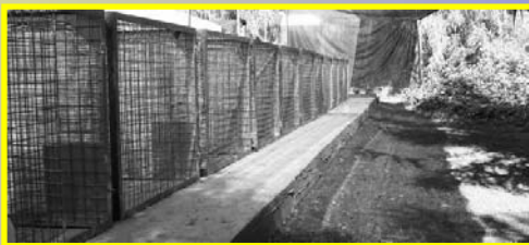
Jaulas a disposición de los socios