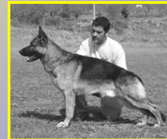
Jasso de Picasental – RCEPPA III