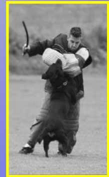
Quito de Breogan RCI III Ch.Nac.CRE 2009