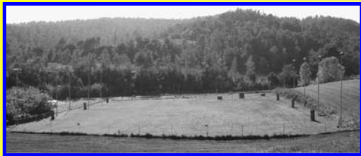
Vista general instalaciones