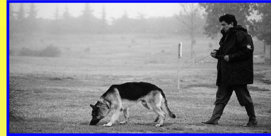
Perro rastreando – Argos de Can Roja RCEPPA II

Preparación para escuelas de trabajo (BH, TEST DE UTILIDAD, RCEPPA, RCI, SchH, ZTP, ...)