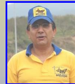
Figurante Oficial RCEPPA y CEPPB

Juez de trabajo del CEPPB (Club Español del Perro de Pastor Belga)