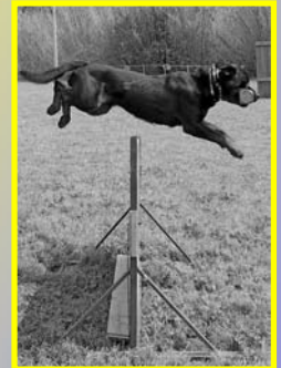
Mont de Can Riera RCI III Ch. CRE 2009 Sub-Ch.CRE 2009

Formación de guías y de ayudantes - figurantes deportivos.