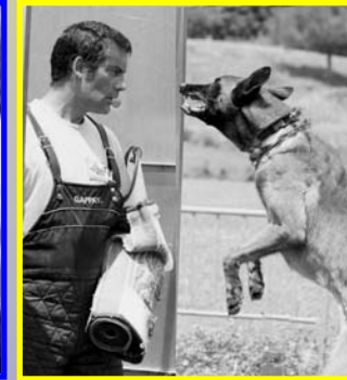
Fasco de Vrunhof RCI III