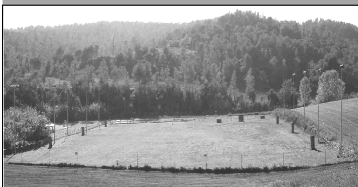
Vista general de las instalaciones, 8.500 m 2